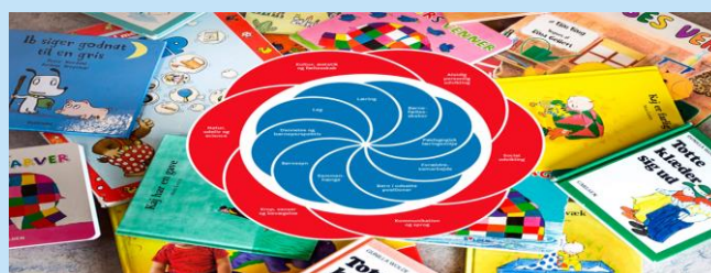
Vi er så heldige, at vi også er en biblioteks børnehave.

Kobberbækken er et børnehus med leg, glæde og børnefællesskaber.