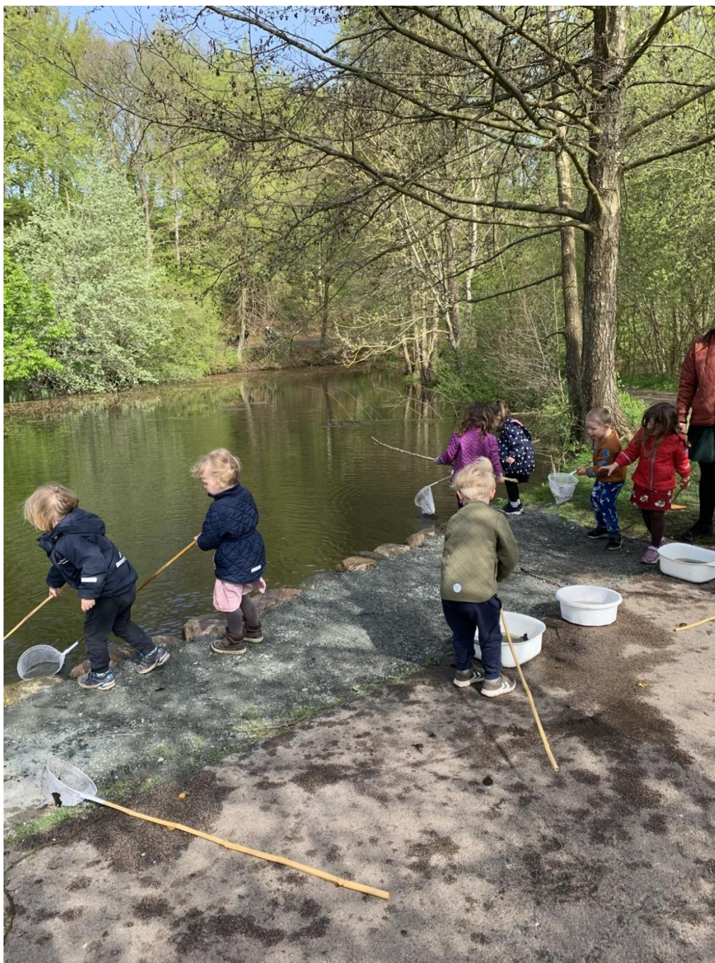
Kobberbækken ligger i og tæt på naturskønne omgivelser.

Tak fordi du valgt at læse vores pædagogiske læreplan.