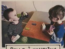
ROLLE I HANDLING