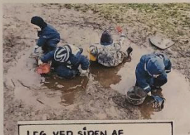
LEG VED SÍDEN AF HINANDEN