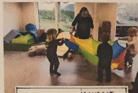
FÆLLESSKAB IGANGSAT AF EN VOKSEN