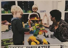
LEGEN FORTSÆTTER MED EN VOKSEN VED SÍDEN