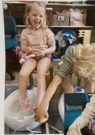
"Ihm... Hvor det kilder!"