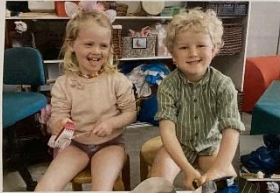
Vi barberer og mærker efter hvad der føles rart og ikke rart.