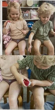
"Lige så forsigtigt, renser jeg dine negle."