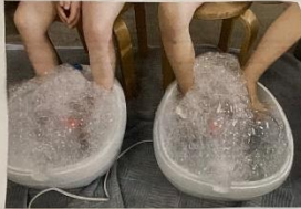
Mmm... Skumbad... 😊