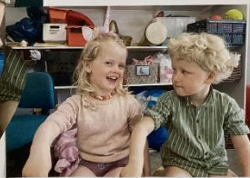
Vi læser og afkader ansigtsmimik og hænder derefter.